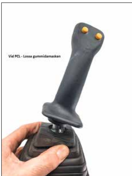
Vid PCL - Lossa gummidamasken