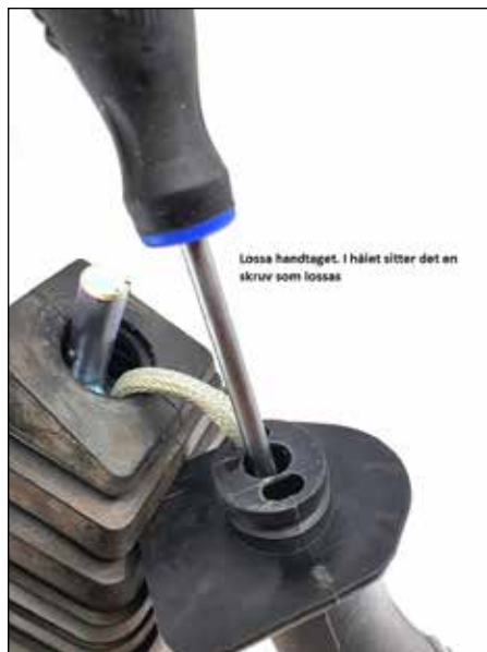
Lossa handtaget. I hålet sitter en skruv som lossas.