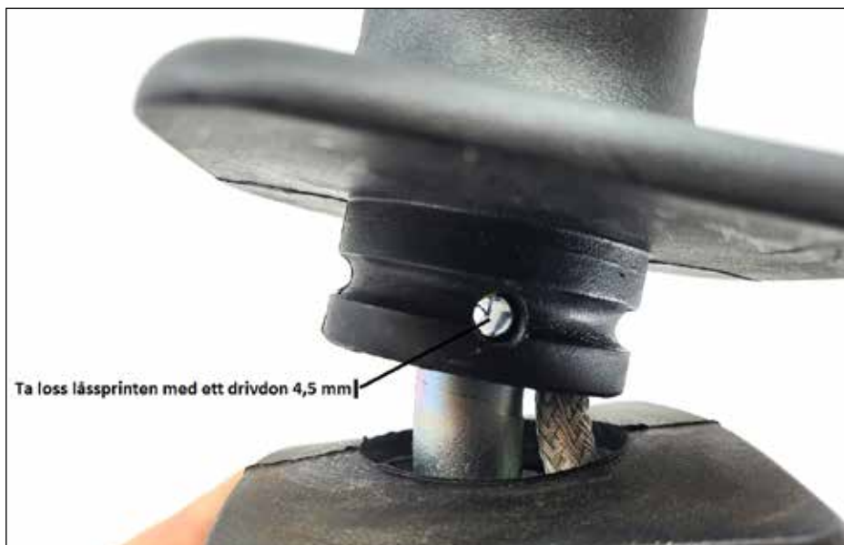
Ta loss låssprinten med ett 4,5 mm drivdon.